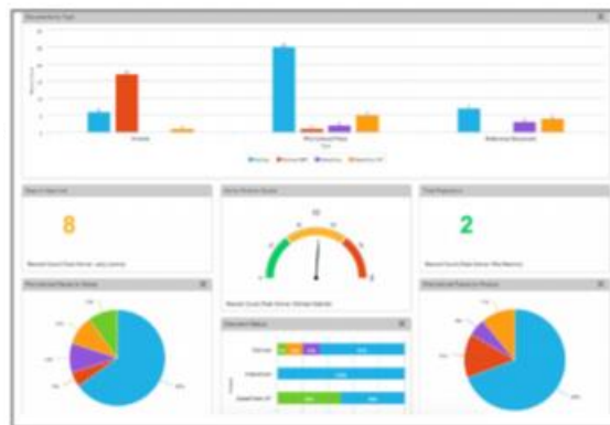
図 1: 実用的なレポート機能

柔軟なレポート機能を使用して、プロセス改善のための、ボトルネックと改善領域の特定を支援します。レポートには製品ごと、作成者ごとのレビューサイクルの平均回数や、製品、エージェンシー、対象市場ごとのアイテムのステータス、承認までのレビューサイクルの平均回数等を表示させる事も可能です。レポートは簡単に設定可能で、ユーザーのニーズに合わせて作成、変更が可能です。ユニークな「使用箇所」レポートは申請対象の販促コンテンツが何処で利用されているかをトラックします。